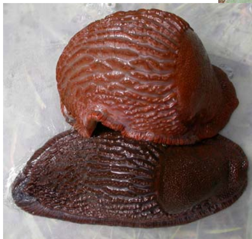
Fargevariasjon hos brunsnegl